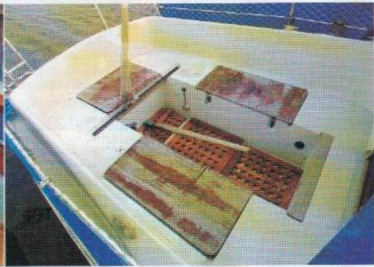
Een mooie klus voor een handige eigenaar: de multiplex deksels van de bakskisten zijn gedelamineerd en de bovenste toplaag is doorgesleten.